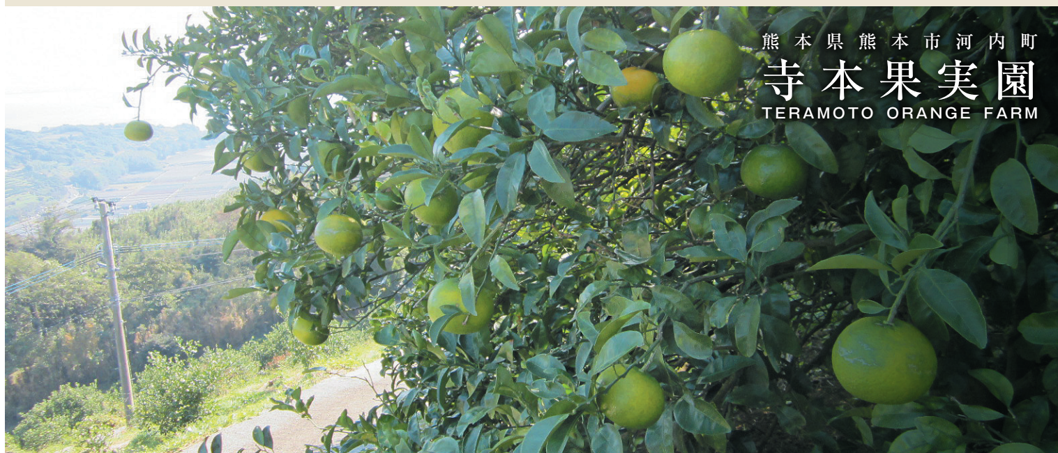
熊本県熊本市河内町 寺本果実園 TERAMOTO ORANGE FARM